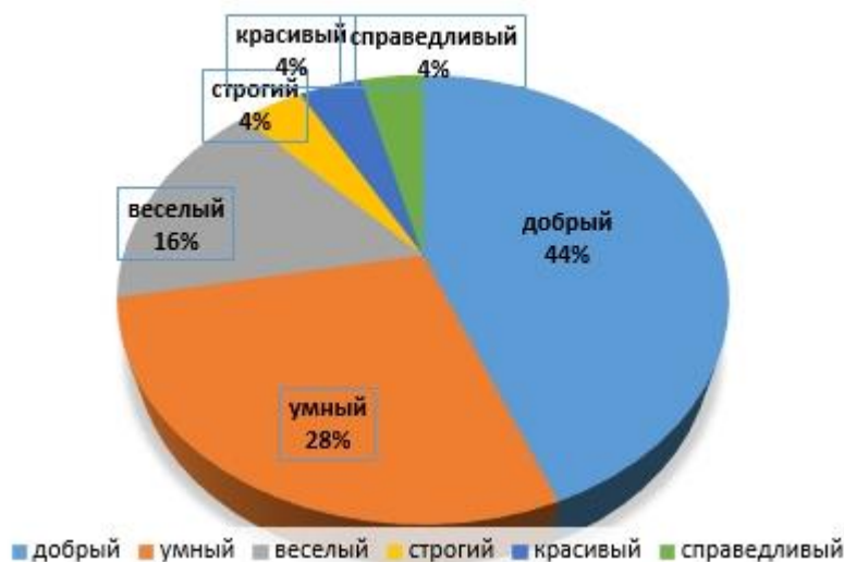
Рисунок 1.Результат опроса «Идеальный учитель-какой он?».